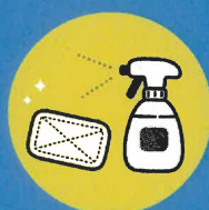
マシン等利用時の消毒